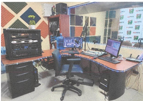
CABINA DE LOCUCIÓN