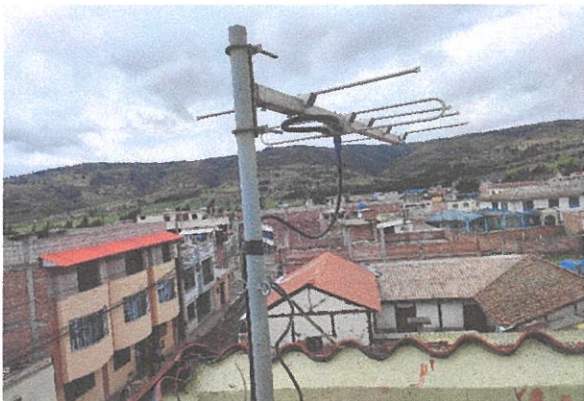
ANTENA DE TRANSMISOR