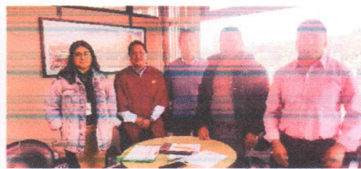
Reunión con el Jefe de Policía Nacional del Distrito Colta - Guamote