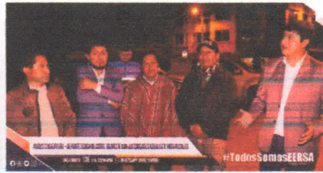
Reunión con los funcionarios de Ministerio de Turismo y Obras Públicas