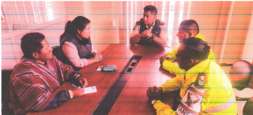
Entrega de proyecto de fomento productivo